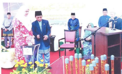
Yang Teramat Mulia dijunjung menyempurnakan penuangan simen.