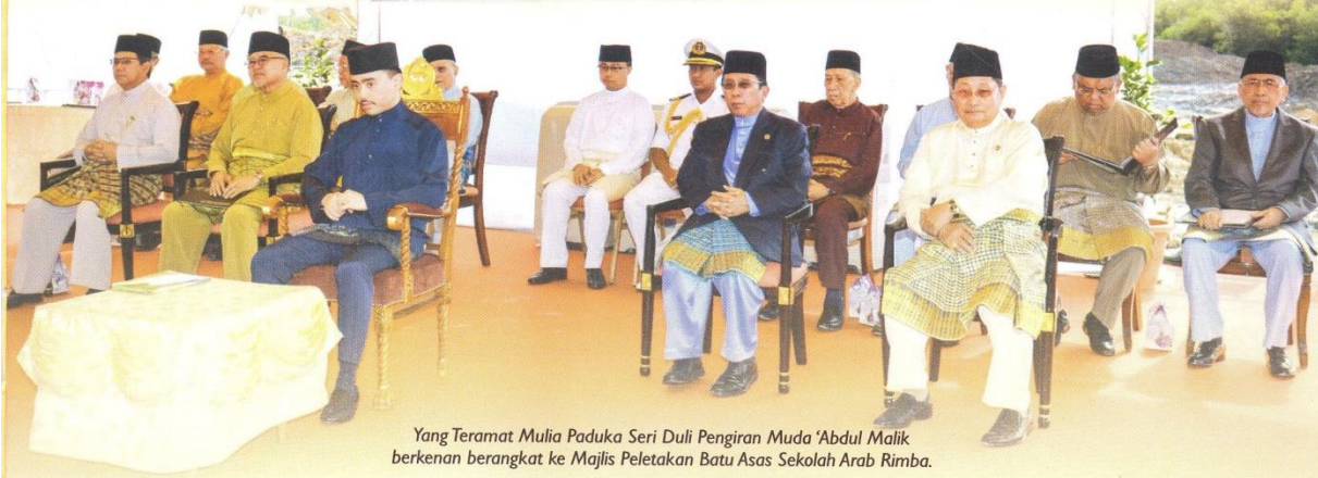
Yang Teramat Mulia Paduka Seri Duli Pengiran Muda 'Abdul Malik berkenan berangkat ke Majlis Peletakan Batu Asas Sekolah Arab Rimba.