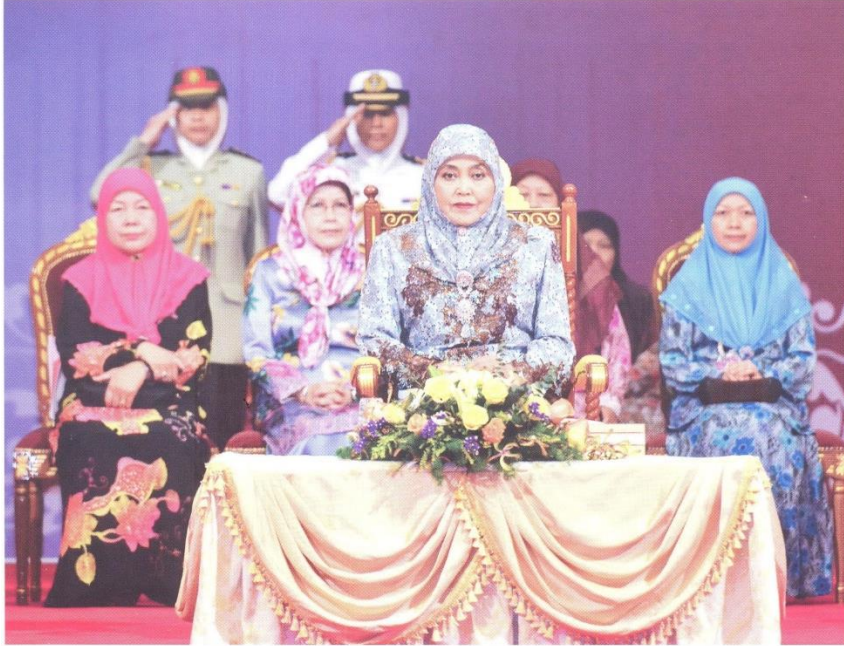
ڪباوه دولي يغمها مليا فادڪ سري بڪندا راج استري فغيران انق حاجه صليحا سماس برکن براڻڪٽ ڪمجلس فرھيمفونن وانيتا سمنفا سمنون مولود نبي محمد صلى الله عليه وسلم تاهون 1436 هجريہ / 2015 مسيحي .