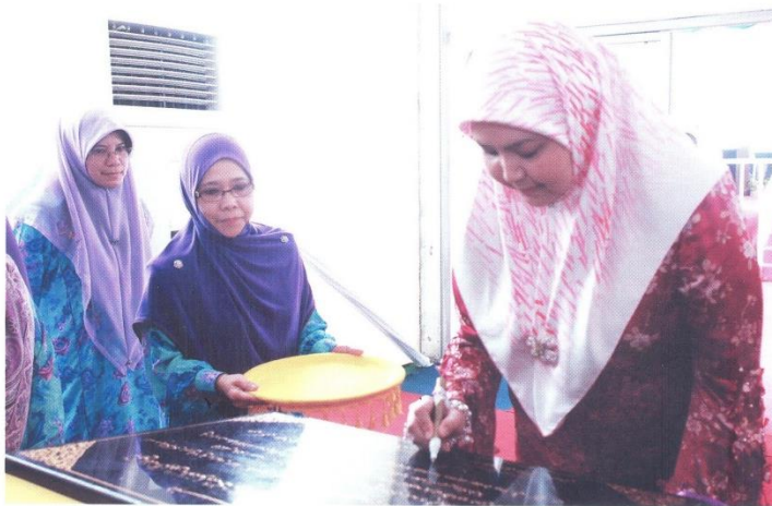
Yang Teramat Mulia Paduka Seri Pengiran Anak Puteri Hajah Rashidah Sa'adatul Bolkiah dijunjung menandatangani plak Peletakan Batu Asas Sekolah Arab Katok.