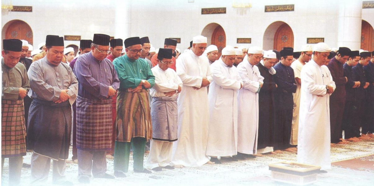
Yang Berhormat Menteri Hal Ehwal Ugama bersama para jemaah semasa menunaikan Sembahyang Sunat Hajat Berjamaah.

BANDAR SERI BEGAWAN – Bagi memohon keselamatan dan perlindungan dari Allah Subhanahu wa Ta'ala bagi Negara Brunei Darussalam daripada segala bencana dan musibah banjir, tanah susur dan hujan lebat, umat Islam di negara ini telah mengadakan Sembahyang Sunat Hajat Berjamaah di masjid-masjid, surau-suaru dan balai-balai ibadat di seluruh negara pada 6 Rabiulakhir 1436 bersamaan 26 Januari 2015.