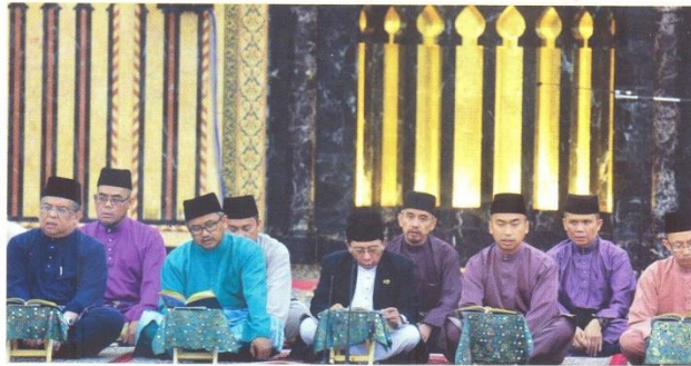
Menteri Hal Ehwal Ugama, Yang Berhormat Pengiran Dato Seri Setia Dr. Haji Mohammad bin Pengiran Haji Abdul Rahman semasa hadir pada Majlis Penutup berkenaan.

Sementara itu persembahan Dikir 'Badat Lana' dibawakan oleh pegawai-pegawai dan guru-guru ugama Jabatan Pengajian Islam, Kementerian Hal Ehwal Ugama. Persembahan Dikir 'Asyraqal' pula dibawakan oleh Pasukan Dikir Jame' 'Asr Hassanil Bolkiah.