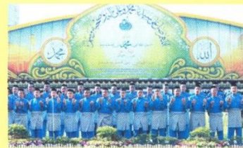
فرسمبن ديکير مرحاباً اوليه فاسوقن ديکير کمترین فرتاهن.

اچارا دتروسکن دشن فرسمبن ديکير مرحاباً دباواکن اوليه فاسوقن ديکير کمترین فرتاهن، دايکوتي تيمتن مريام سباق 21 دس سباک سهاج سفاي کهد 'ياحبيبي'.