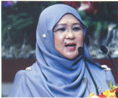
چرامه خاص دسمفايکن اوليه دکور دايع حاجه رسينه بنت حاج اھيم.

باکي ممبرکي مجلس، دعاء سلامت دباچکن اوليه فغاره فوسه بهاس کوليچ اونيرسيي فرکوروان اگام سري بگاډون، فغيران دکور حاجه سلميه بنت فغيران حاج شهودين. ساومفما اين، دان فد تاهون اين سمبوتن دکنداليکن اوليه کمنترين حال احوال اگام دغن کرجسام کمنترين کواڅن دان توروټ دجاياکن اوليه مجلس وانيتا نگارا بروني دارالسلام. تيما سمبوتن مجلس فرهيمفونن خاص وانيتا سمفنا سمبوتن مولود بني محمد صلى الله عليه وسلم فريڅکت نگارا باکي تاهون 1436 هجره ايله 'وانيتا صالحه فليتا اومه'.