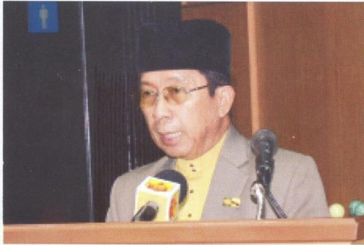
Menteri Hal Ehwal Ugama, Yang Berhormat Pengiran Dato Seri Setia Dr. Haji Mohammad bin Pengiran Haji Abdul Rahman semasa berucap.