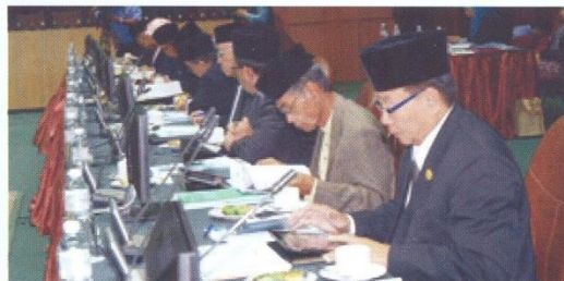
Sebahagian dari Yang Berhormat Ahli-Ahli Mesyuarat Negara yang hadir di Majlis Perjumpaan Muzakarah di antara Kementerian Hal Ehwal Ugama bersama Ahli-ahli Yang Berhormat Majlis Mesyuarat Negara.

Perjumpaan antara lain bertujuan untuk mendapatkan 'input' bagi meningkatkan mutu perkhidmatan Kementerian Hal Ehwal Ugama serta bertukar-tukar pendapat bagaimana untuk meningkatkan mutu perkhidmatan yang cemerlang, di samping mengeratkan hubungan silaturrahim di antara kedua-dua belah pihak. Selain itu, perjumpaan ini juga dihasratkan sebagai 'platform' untuk mendengar cadangan dan bertukar-tukar pendapat bagaimana untuk meningkatkan mutu perkhidmatan di kesemua jabatan-jabatan di bawah Kementerian Hal Ehwal Ugama.