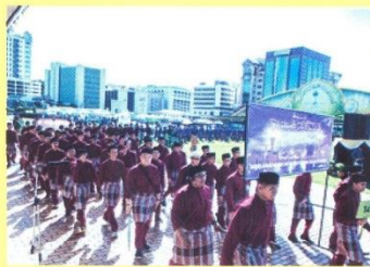
سهاکين درفد فاسوقن پيرتايي فرارقن

فد تاهون اين سباق 132 فاسوقن ترديري درفد فاسوقن براونفورم، کمترین ۲ دان جباتن ۲ کراجان، مجلس فرونديش مقيم دان