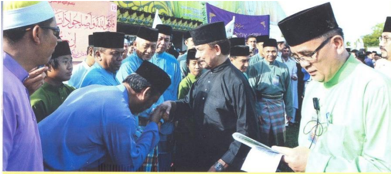
کباوه دولي پشما مليا سمناس دسمبه کلکن کهد فاسوقن-فاسوقن پيرتايي فرهيمفون دان فرارقن ترسبوت.