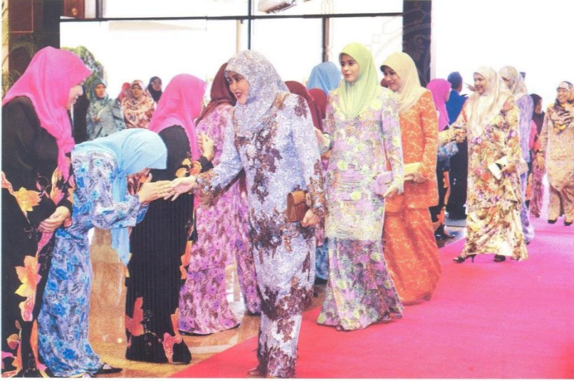
کباوه دولي ښه مليا فادک سري بگندا راج استري سرت أهلي ۲ قرابه دراج برکن منريما جونوڅ زياره أهلي ۲ جواتنکواس توتیځکي مجلس سږوروس کيراڅکن دفوسه فرسيداڅن اتارا ښهس براکې.

اتورچارا مجلس دتروسکن دغن سمبه الو-الوان اوليه فغروسي برسام مجلس فرهيمفونن خاص وانيتا باکي تاهون 1436 هجره، رئيس کوليچ اونيرسيي فرکوروان اگام سري بگاډون، دکور حاجه مسنون بنت حاج ابراهيم.