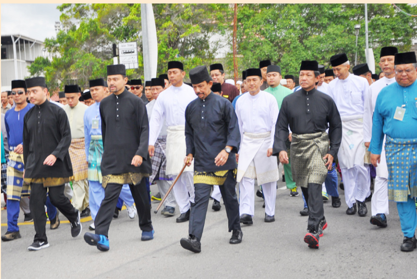
کباوه دولی یغمها ملیا برسام أناکدا ۲ دان آدیندا بکیندا مولان فراراکن

مناکالا ایت ددایره تمبوروغ فولا داداکن دفادغ دیوان کمشارکتن فکن باغر تمبوروغ دان تنامو کرمتن ایاله ستیا اوسها تنف کمترین کصیحتن، اوغ حاج سیف البحري بن حاج اوغ منصور.