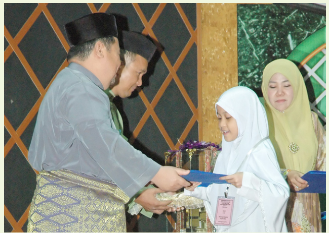
Salah seorang pemenang menerima cenderamata daripada tetamu kehormat.