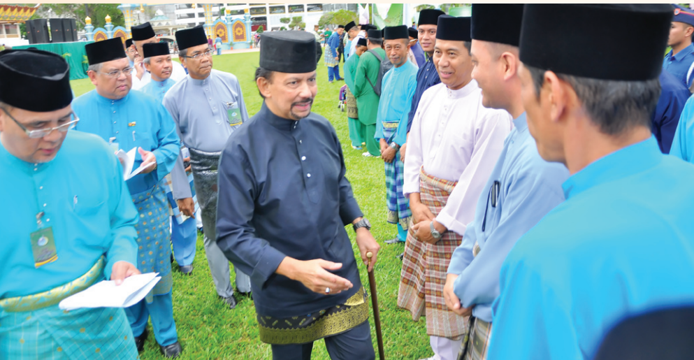
كباوه دولي يغمها مليا برامه مسرا برسام فسرت فراراكن

مجلس دمولاكن دغن بجان سورة الفاخته برامي-رامي دكواي اوله مفتي كراجان، يغير حرمة فيهمين داتو سري مهاراج داتوء فادك سري ستيا (دكتور) أستاذ حاج اواغ عبدالعزيز بن جونبد.