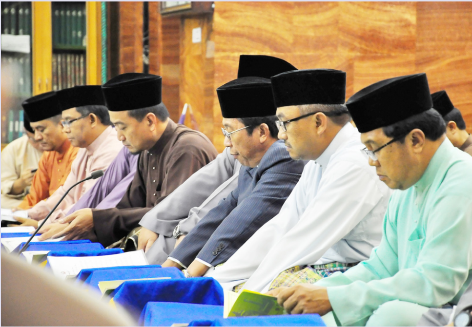
Menteri Hal Ehwal Ugama bersama pegawai-pegawai kanan Kementerian Hal Ehwal Ugama semasa menghadiri majlis berkenaan.