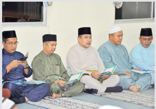
Suasana sekitar majlis.