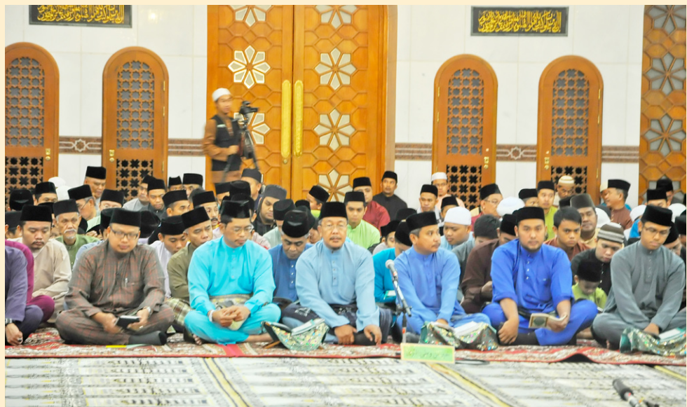
Di antara jemputan yang turut hadir menyemarakkan majlis berkenaan.

pengarah-pengarah, pegawai-pegawai kanan dan kakitangan dari Kementerian Hal Ehwal Ugama serta para jemaah dan penduduk kampung yang tinggal di sekitarnya.