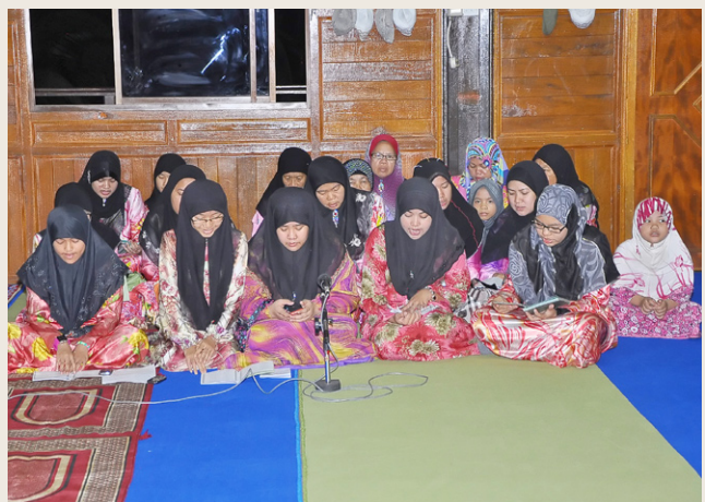
Persembahan tausyeh daripada belia-belia Kampung Bebuluh menyeronokkan lagi suasana majlis.