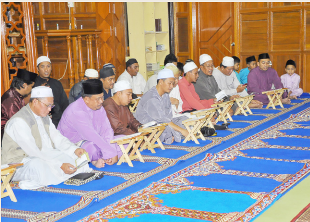
Rombongan lelaki Pusat Da'wah Islamiah tidak ketinggalan untuk turut serta bersama saudara-saudara baru di majlis berkenaan.

Majlis yang sama juga berlangsung di Pos Da'wah Kampung Selapon, Daerah Temburong. Mengetuai