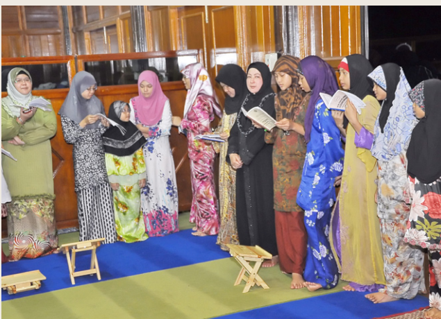
Sebahagian daripada saudara-saudara baru yang turut hadir di majlis berkenaan