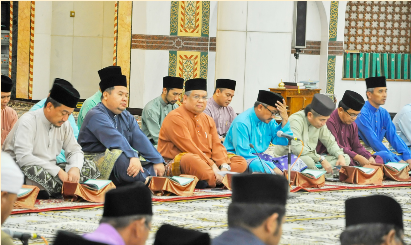
Tetamu kehormat dan jemputan khas di majlis berkenaan.