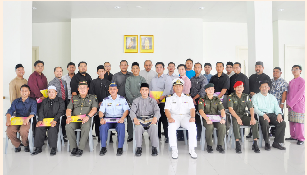
Peserta kursus lelaki.