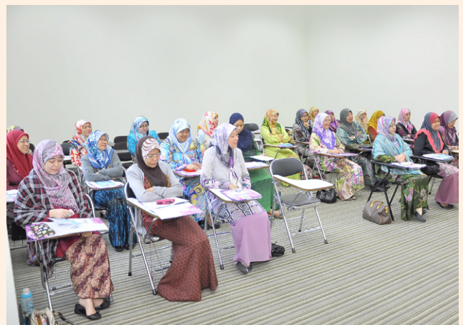
Peserta kursus perempuan.