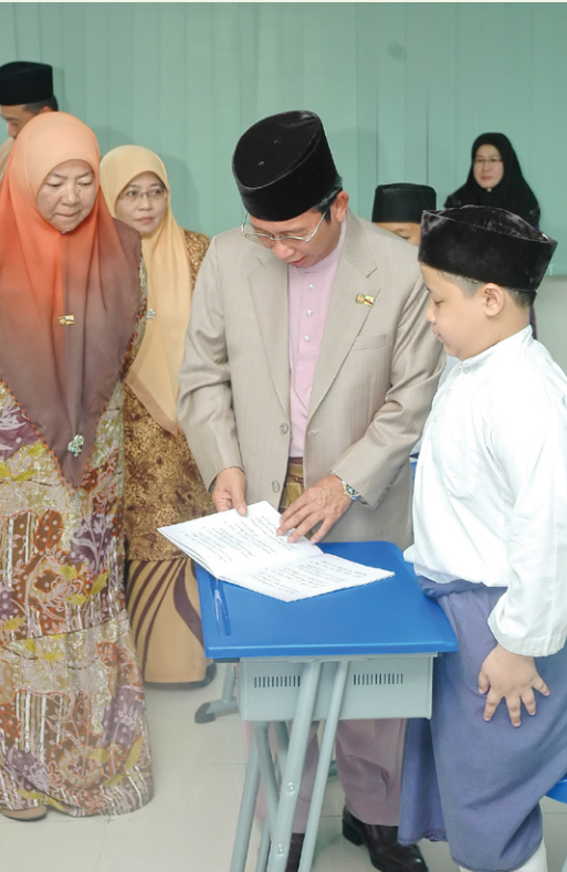
منتری حال احوال اُکام سَماس مَبوَاة لاوتن کبلیک ۲ درجه

جلس یغ بر حرمت فغیران داتوے لاکي، کورو- کورو اُکام داري جباتن فغاجین اسلام، کمنترین حال احوال اُکام تله داتورکن انتوق منجادي تناک فغاجر دسکوله-سکوله این، کوریکولوم یغ دأجرکن ادله سام سفرتي سکوله-سکوله اُکام کراجان.