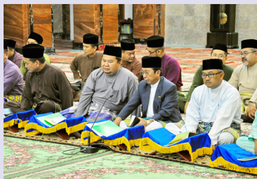
Suasana sekitar majlis diadakan.