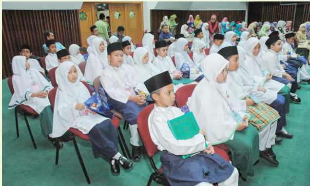
Sebahagian daripada peserta-peserta yang mengambil bahagian.