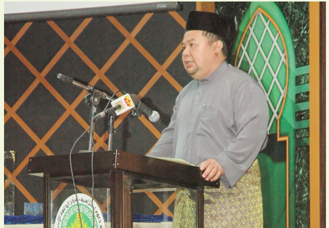
Tetamu kehormat semasa berucap di majlis berkenaan.

Menyentuh mengenai Skim Galakan Khatam Al-Qur'an Murid-Murid Di Bawah Umur 10 Tahun Bagi Sekolah-Sekolah Ugama dan Arab Kali Ke 22 Tahun 1433H/2012M ini, beliau menambah, pengajaran dan pembacaan al-Qur'an