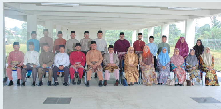
سيسي بر كمبر رامي