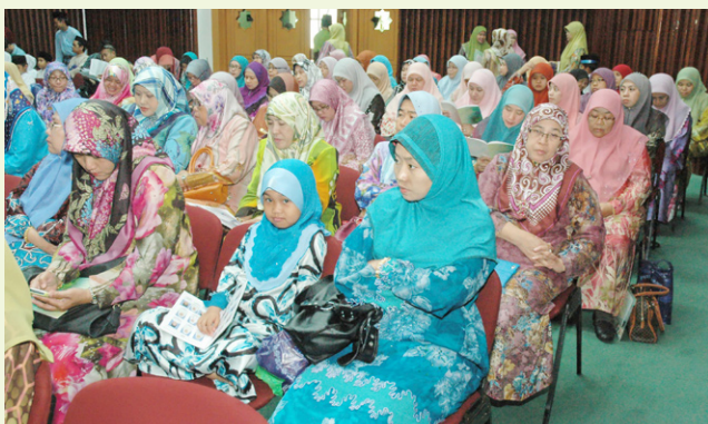
Sebahagian daripada jemputan yang hadir.

di peringkat awal kanakkanak sememangnya dituntut dan digalakkan yang mana pengajaran al-Qur'an kepada mereka melalui pembacaan adalah sebagai satu usaha menanamkan asas keimanan yang padu dalam jiwa raga mereka.