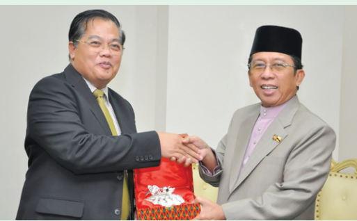
منٺري حال احوال اُڪام سمس منٺري چندرامات درفد توان يڻ تراوٽام داتوءِ عثمان حسن