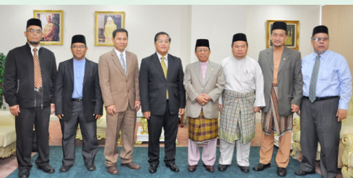
منٺري حال احوال اُڪام دان روميون درفد ڪمنٽرين بوروه دان لاتيھن بوكيسيونل ڪراچان ڪمبوجا

أواڻ حاج عبدالعزيز بن أورڻ ڪاي مهاراج ليلا حاج محمد يوسف دان تيمبالن ستيا اوسها تنف ڪمنٽرين حال احوال اُڪام، أواڻ حاج هارون بن حاج جونيد.