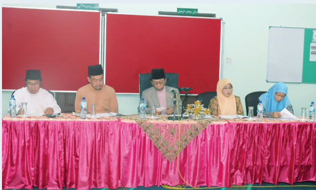
منتري حال احوال اكام سماس مغازي تعليم

(Sambungan dari muka surat 4) سكوله اين مولا دكوناكن فد ١٩ جون ٢٠١٢ دان بوله منمفوغ كراميان ٢٠٠ اورغ فلاجرن. توروت مبرتاي لاوتن ترسيوت اياله تيمبالن