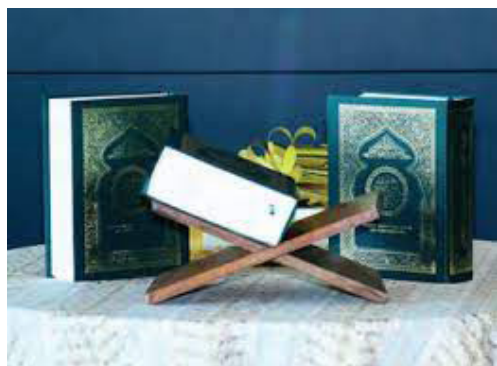
Mushaf Brunei Darussalam dan Terjemahan 30 Juz al-Qur'an

Kedua-dua set tafsir tersebut apabila terbit dan tersebar nanti, In syaa Allah , ianya merupakan tafsir al-Qur'an versi negara ini yang akan turut menambah banyak lagi bahan rujukan memahami kandungan al-Qur'an, di samping